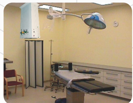
Hospital Univ. Austral (Buenos Aires)